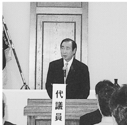
大野県議会議長あいさつ