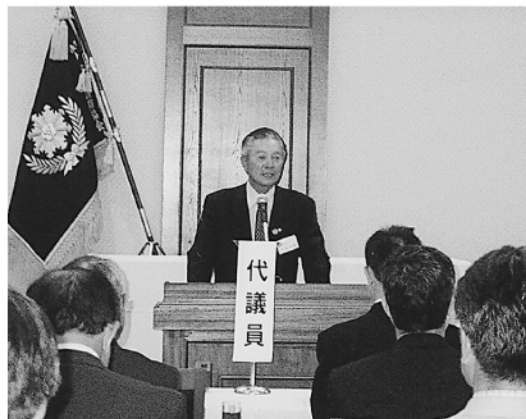
中泉会長あいさつ