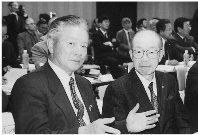
日消代議員会に出席 中泉会長・奥山副会長