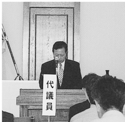
高橋県警本部警備部長あいさつ