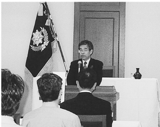
品田出納長あいさつ