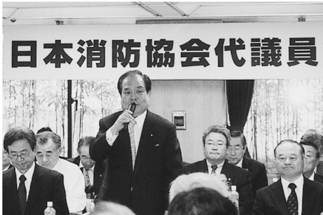
(財)日本消防協会 片山会長あいさつ

昭和二十一年九月十一日生まれ(六十歳) 昭和四十一年四月一日東由利村消防団に入団する。昭和四十九年四月一日町政施行により東由利町消防団となる。昭和五十八年六月一日班長、部長、副分団長を経て、平成元年六月一日分団長、平成三年五月三十一日退職後、同年七月十日副団長として再入団。平成九年六月一日東由利町消防団長、平成十七年三月二十二日市町村合併により、由利本荘市消防団副団長兼東由利支団長、平成十九年五月一日由利本荘市消防団長兼東由利支団長となる。(農業)