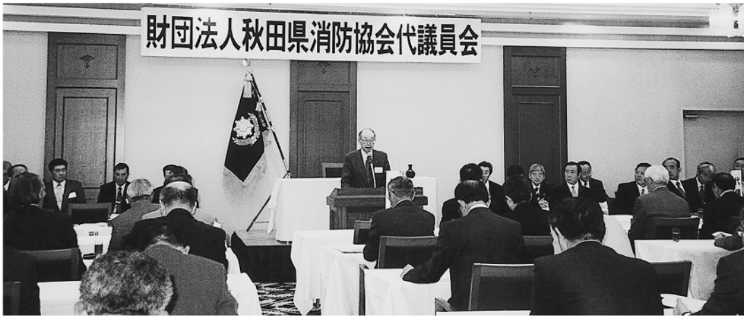
奥山副会長開会のことば

印 刷 〒010-0951 秋田山王7丁目5-29 株式会社 松原印刷社 電話 018-862-8760